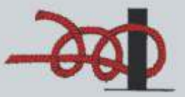
Zwei halbe Schläge

Dient zum Belegen von Festmachern auf Pollern, an einer Reling und anderen festen Gegenständen und ist meistens mit zwei halben Schlägen gesichert